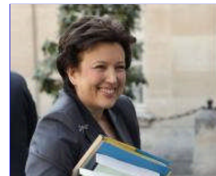
Roselyne Bachelot, ministre des Solidarités et de la cohésion sociale, arrive, le 5 mai 2011 à l'hôtel Matignon à Paris